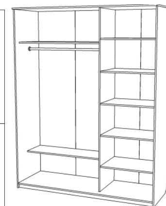
Изделие в сборе без рельсов и дверей